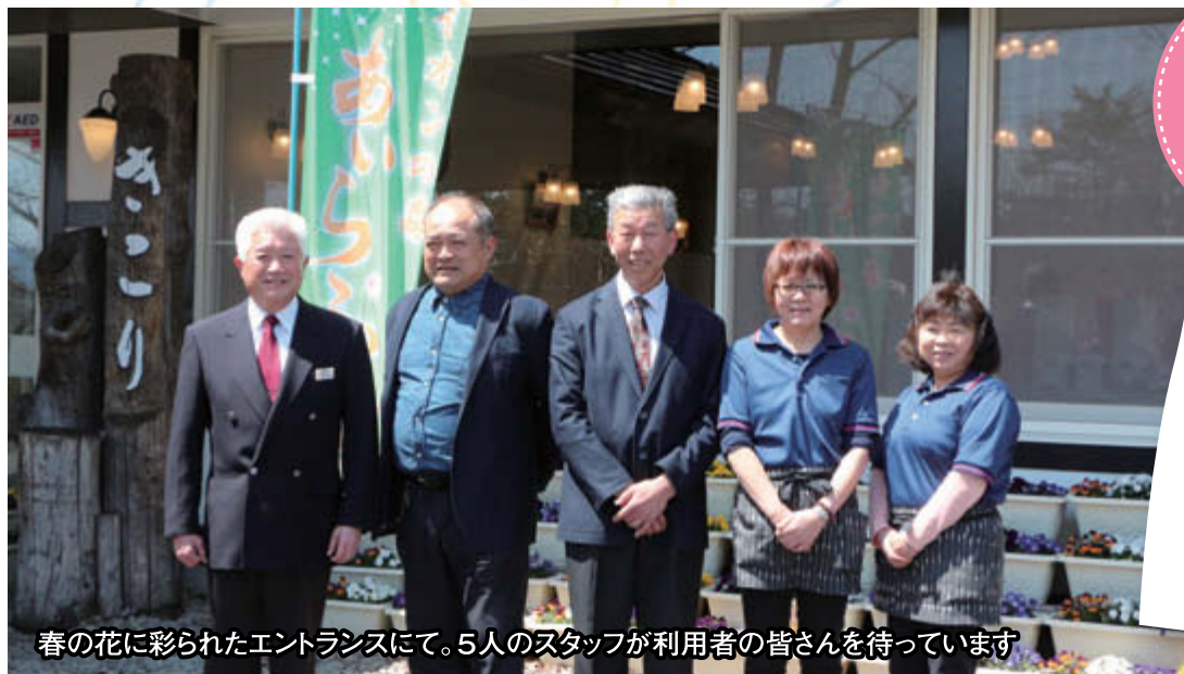
春の花に彩られたエントランスにて。5人のスタッフが利用者の皆さんを待っています