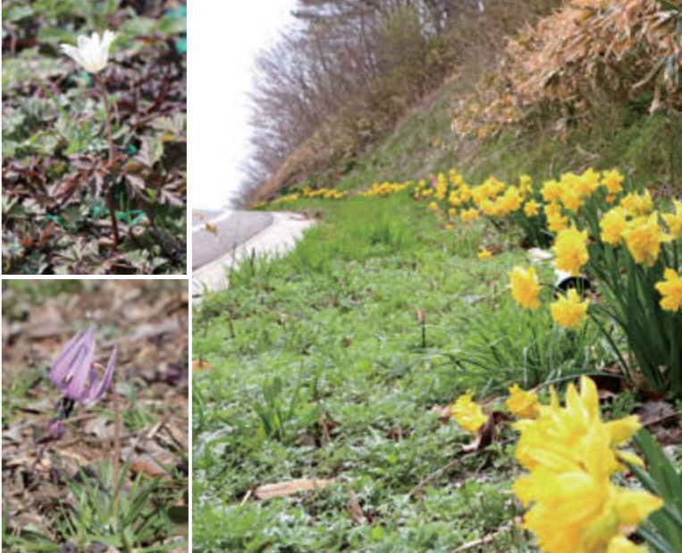
水仙が導く久保曾の道。一角には野の花の可憐な姿も見える