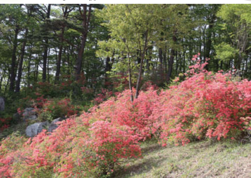
大火山のツツジ(平成27年5月撮影)

山ツツジの見頃は、5月初旬から。震災前から整備を行っている村議会OB会の皆さんが、毎年、草刈りなどして、手入れを続けています。「いつか名所として、皆が訪れる場所になってほしいんだ」。鮮やかな朱色やオレンジがかつたピンクなど、色合いの違う山ツツジのグラデーションが、新緑との見事な競演を見せてくれます。