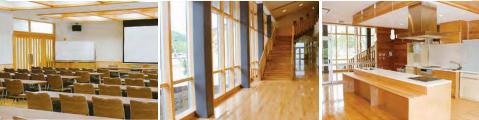
▲スクリーン設備のある大・小研修室 ▲木のぬくもりを活かした交流回廊 ▲開放的で明るいキッチンスタジオ