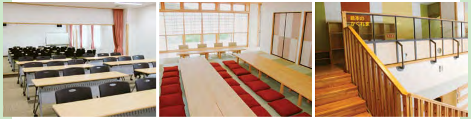
▲ダンス教室にも使用できる視聴覚室 ▲明るく温かみのある和室もあります ▲階段の先には「絵本のかくれ家」

申込み先 飯館村交流センター ☎0244-42-0072 〒960-1801 飯館村草野字大師堂17番地