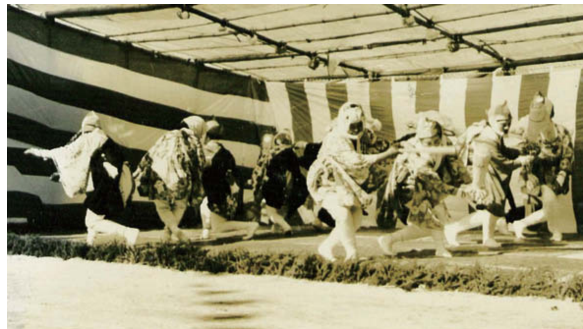
秋の農作業の繁忙期が終わると、恒例の「農業文化祭」が催されました。写真は半世紀以上さかのぼる昭和37年、特設のステージで、各地域が自慢の田植え踊りを披露するひとこまで。会場は相馬農業高校飯舘分校（現在の飯舘校）。数々の催しが行われ、この日は約6,000人が足を運んだそうです。