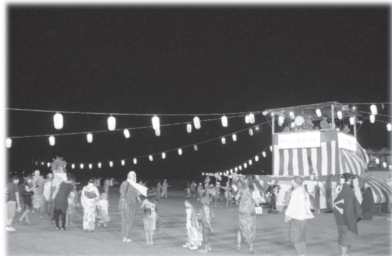
仮装するも観るもよし。楽しく盛り上がる飯樋の盆踊り（平成22年8月）