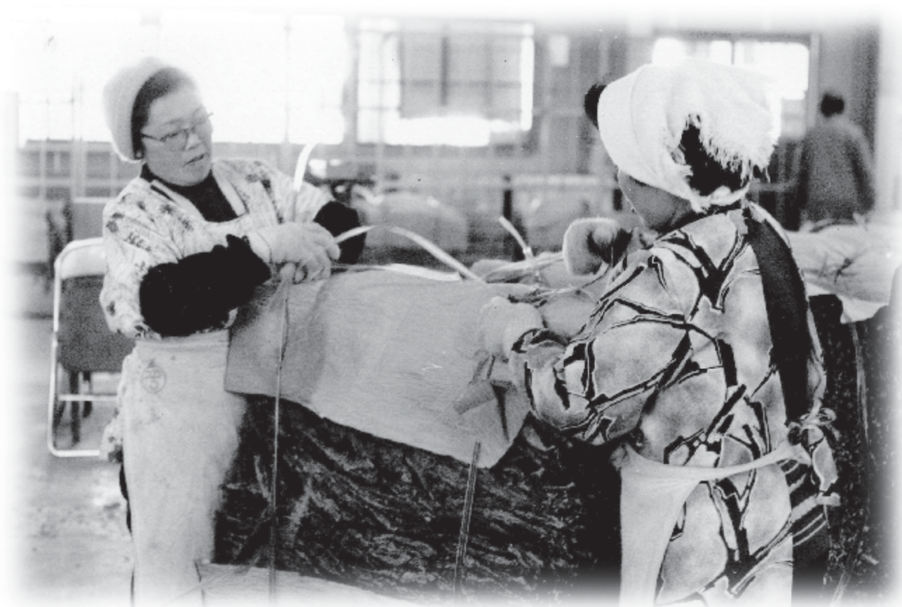
生産者の努力により主要産品となっていた葉たばこの収納作業（昭和52年1月）