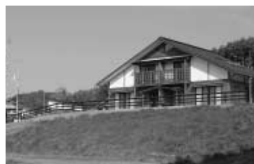
平成15年度で整備が終了した笠石団地