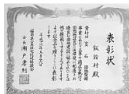
村に贈られた表彰状

この表彰は、平成15年度に整備した県内の住宅団地の中から選ばれたもので、飯館村のほかにも県内7団地が表彰されました。