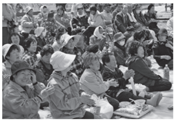
歌にダンスに笑いと拍手が起こります