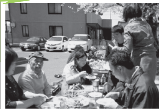
気心知れた住民同士の和やかな時間