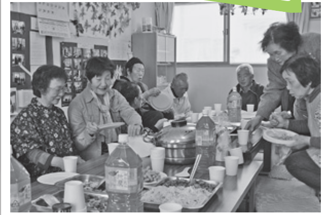
集会所に心づくしの手料理が並びました