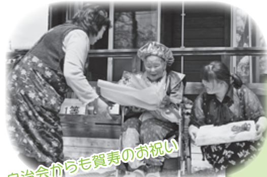
自治会からも賀寿のお祝い