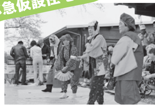
衣装も華やか伊丹沢の大黒舞