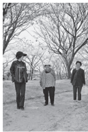
満開の花に包まれて散策

桜の名所・川俣中央公園で花見の会です。会員50人ほどが集まり、乾杯の後はお弁当を囲んでおしゃべり。満開の桜の下でする互いの近況報告も、話はずみです。食事が済むと、出店が並んだ公園を散策したり、村の人同士、和気あいあいと一日を楽しみました。