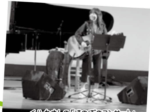
イルカさんの「ほのぼのコンサート」 胸に響く歌と心和むおしゃべりで