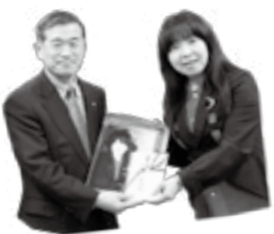
各地のコンサートで集った義 援金を村へ贈るイルカさん