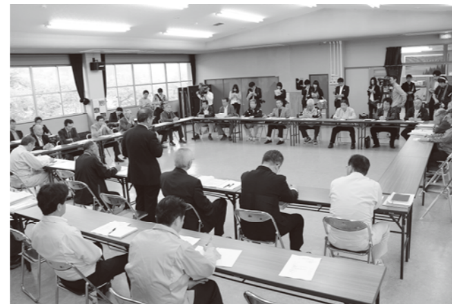
▲臨時行政区長会のようす