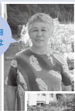
野菜の種類も豊富でにぎやかな畑