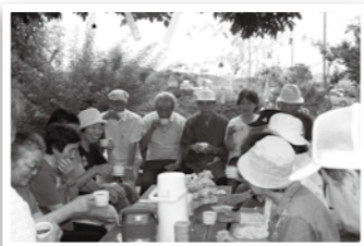
コーヒーと持ち寄りのお茶受けでおしゃべりもはずみます