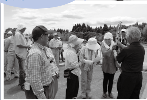
優勝した第9班のみなさん

5月に住民有志が整備したグラウンドで、住民の班対抗グラウンドゴルフ大会が開催されました。続く熱戦を制して優勝したのは第9班。メンバーが勝利を喜び合いました。また、晴天の下で汗を流した参加者からは口々に「久しぶりに体を動かして楽しかった」という声が聞かれました。