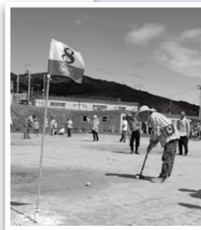
広々としたグラウンドの頭上に広がる青空

5月に住民有志が整備したグラウンドで、住民の班対抗グラウンドゴルフ大会が開催されました。続く熱戦を制して優勝したのは第9班。メンバーが勝利を喜び合いました。また、晴天の下で汗を流した参加者からは口々に「久しぶりに体を動かして楽しかった」という声が聞かれました。