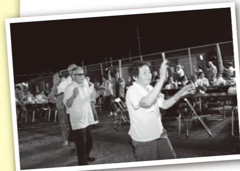
▲お祭りのシメには「相馬盆歌」で盆踊り

会場は、仮設住宅に隣接する公民館の敷地です。伊達市商工会が焼きそばやたこ焼き、かき氷などを、前田行政区の女性グループがわらび大福を振る舞い、地元の創作太鼓の演奏や盆踊りなども行われて、参加者は夏の一夜を共に楽しみました。