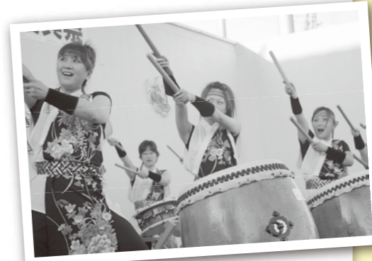
▲勇壮な響きを彩る華やかな振り付け