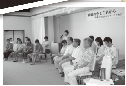
▲討論会「飯館の今とこれから」のようす