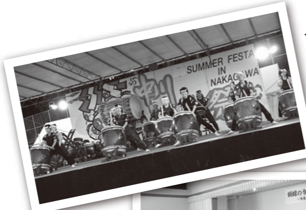
勇壮な陣馬太鼓の演奏も