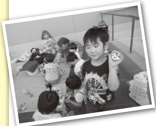
▲吉倉公務員宿舎で。石にカラフルな模様づけ