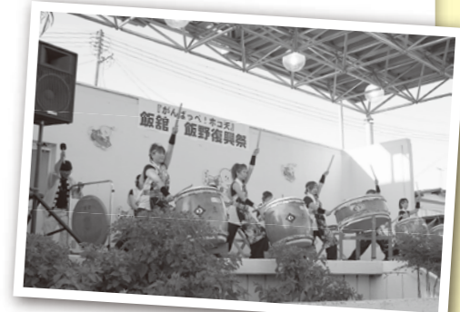
▲ドラを担当する会長を除き全員が女性。最年少は中学生です