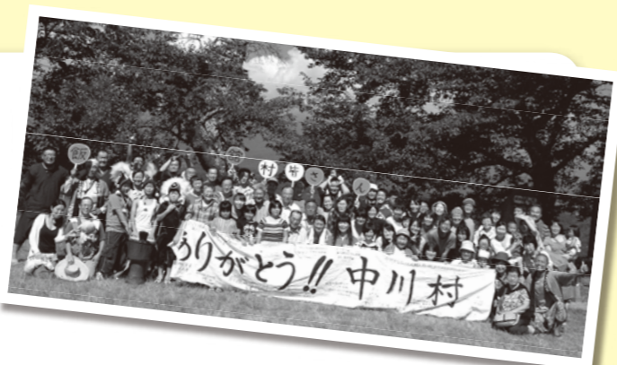
▲「中川村までのカネネットワーク」の皆さんと

中川村では、アフリカ太鼓の演奏やダンス、保育園児たちからの歓迎の言葉など、温かい出迎えを受けました。また、滞在中は登山や祭りへの参加などを通して地元の方と触れ合い、参加者からは、「避難の現状を話したり、励ましの言葉をいただいたりして、新たな活力がわいてきました」との感想がありました。