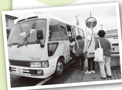
◀写真は後日9月21日の利用のようすです ▶ いやしの宿の入口まで送迎します ▶

福島・伊達方を回る「いやしの宿いいたて」送迎バスの運行が始まりました。バスの定員は25人で利用には予約が必要です。借り上げ住宅に入居する利用者は「バスが出て『いやしの宿いいたて』を利用するようになりました。普段出歩く機会がないのでストレス解消になります」と話していました。夏の暑さも去り温泉がより心地よい季節。送迎バスをどうぞ有効にご活用ください。