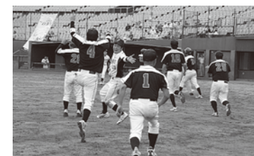
◀サヨナラのランナーを迎える選手たち