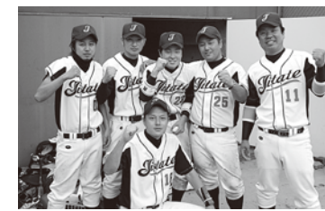
▲粘り強い闘いで2回戦進出!