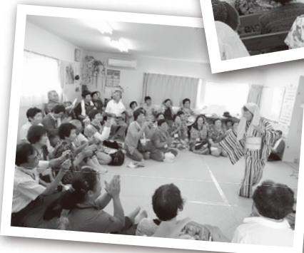
◀静岡県が舞台の「唐人お吉」の物語を歌と踊りで。熱演に拍手