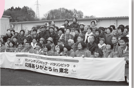
笑顔で記念撮影も