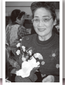
フラワーアレンジメントも素敵