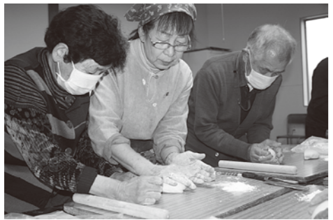
中央がよーこばっば。うどんの生地をのばすところです