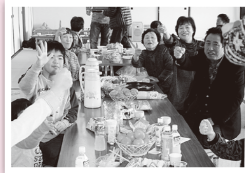
みんなで楽しくじゃんけん勝負