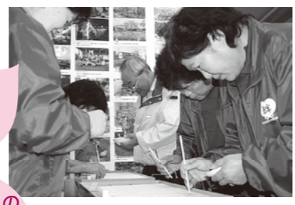
割りばしの先で種を取り播いていきます

NTTファシリティーズから植物工場用機材の支援を受けて、集会所でリーフレタスの試験栽培が始まりました。この日は班長さんらが栽培方法の説明を聞きながら、専用のスポンジの穴に1つずつ種を播きました。