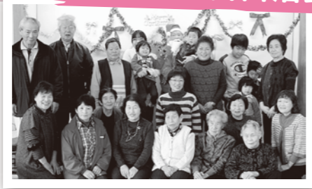
3自治会ができて目回りの交流会

県青少年会館の広い和室でクリスマス会を開きました。じゃんけん大会などを楽しんだ後は、サンタさんから子どもたちへのプレゼント。愚真会が振る舞う温かいそばも味わって、ほのぼのと楽しい時間を過ごしました。