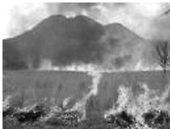
▲延焼拡大した状況