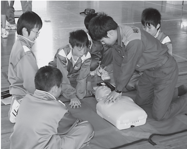
▲心臓マッサージ方法を学ぶ中学生たち