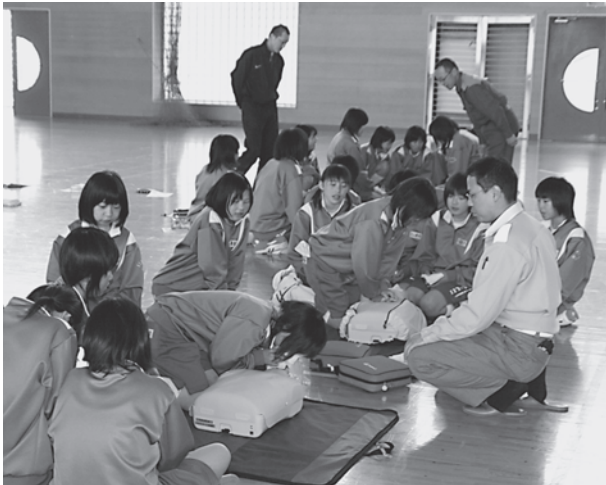
▲人形を使っの講習のようす