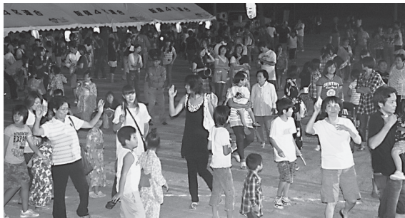
▲賑わいをみせた祭りのようす

また、会場には、老人会、子供会・育成会、婦人会、生産組合、各地域の若者による模擬店が並び、来場者は、焼きそば、アイスクリーム、チョコバナナなどを買い求めていました。フィナーレには、花火が打ち上げられ、来場者は、夜空に浮かぶ夏の風物詩を楽しんでいました。