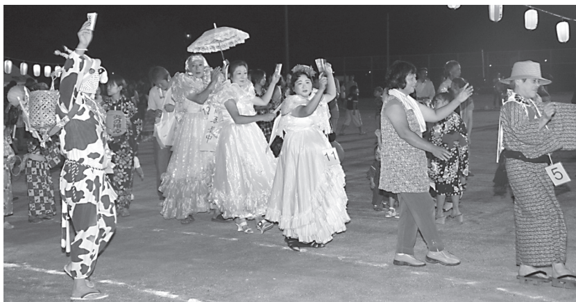
▲華やかな衣装が印象的な花嫁の仮装