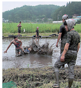
▲思わずどろんこにダイブ!?

その後、どろんこバレーボールやラグビーを行うなど、熱が入ったゲームに、大人も子どもも全身泥だらけになってハッスルしていました。