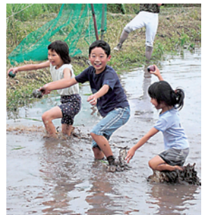
▲「カプセル見つけた～」