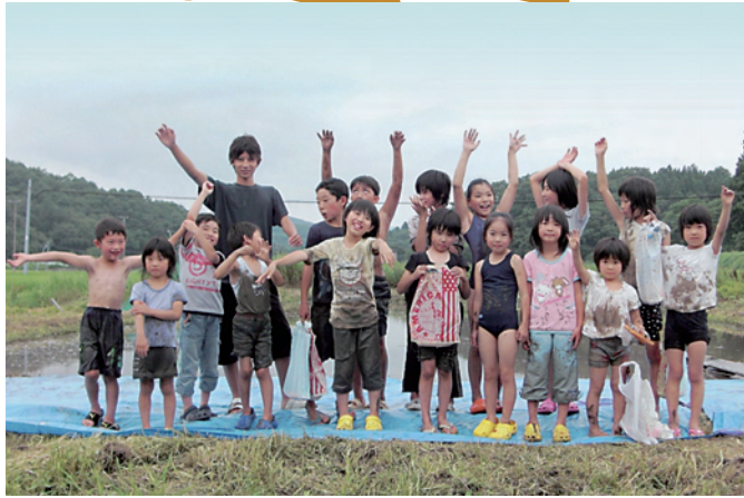
▲全身泥だらけになって楽しんだ子どもたち