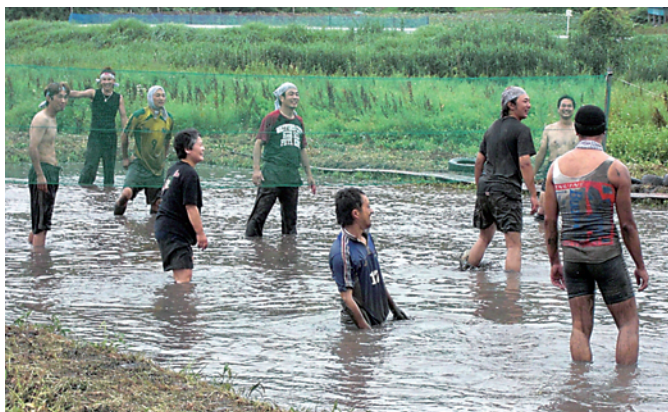
▲大人も楽しんだどろんこバレーボール

宮内行政区で、休耕田を利用した「どろんこ祭り」を開催し、大人や子どもたち合わせて、45人が参加しました。