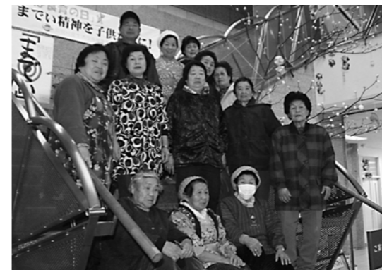
▲飯樋4区ミニデイサービスの皆さん